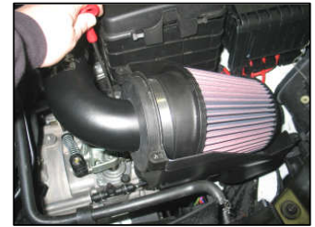
Fig. # 16