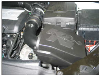
Fig. # 17