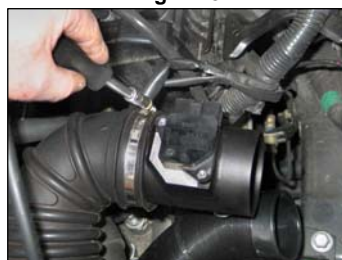
Fig. # 22