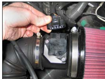
Fig. # 26